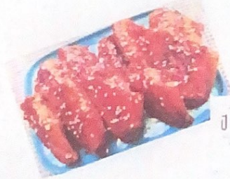
ปีกไก่เทอริยากิ