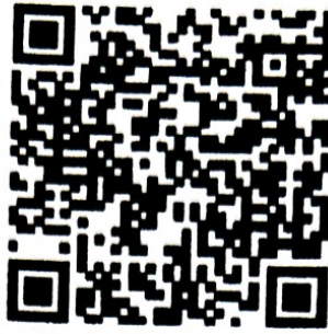
QR Code สำหรับรับฟังความคิดเห็นผ่าน ระบบกลางทางกฎหมาย