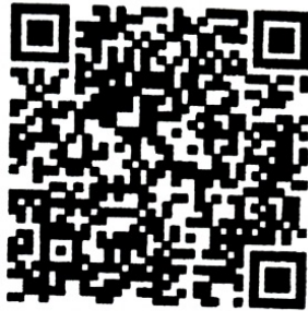
QR Code ร่างพระราชบัญญัติควบคุมการจัดมหรสพ ที่มีการใช้เครื่องขยายเสียง พ.ศ. ....